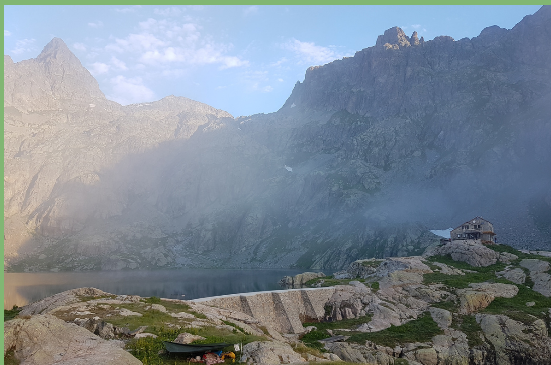
REFUGE DE VALMASQUE, 2233m Nuit 1