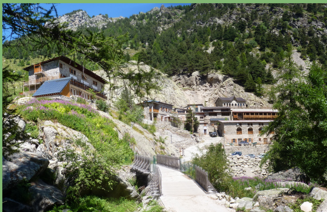
REFUGE NEIGE ET MERVEILLES, 1408m Nuit 3