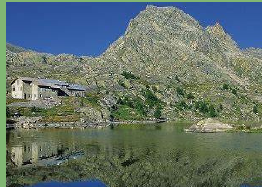
REFUGE DES MERVEILLES, 2130m Nuit 2