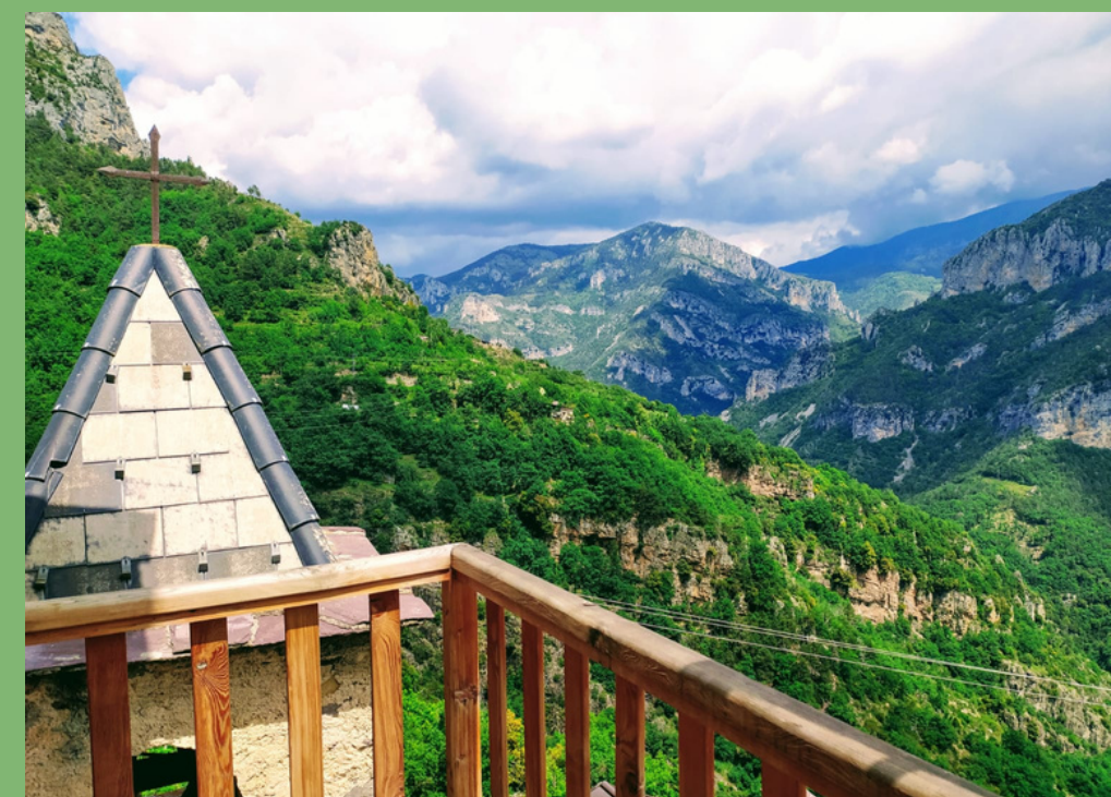
GÎTE LE BERCHON, Berghe, 900m Nuit 4 et 5